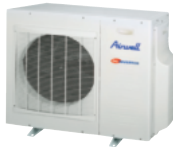
Aussengerät GCD 30