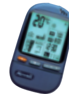
Lieferung mit Fernbedienung RC4