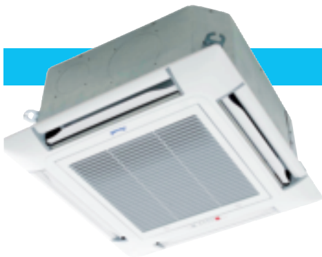
Innengeräte CKD 30/36