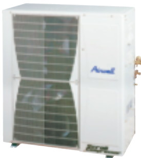
Aussengerät GCD 36